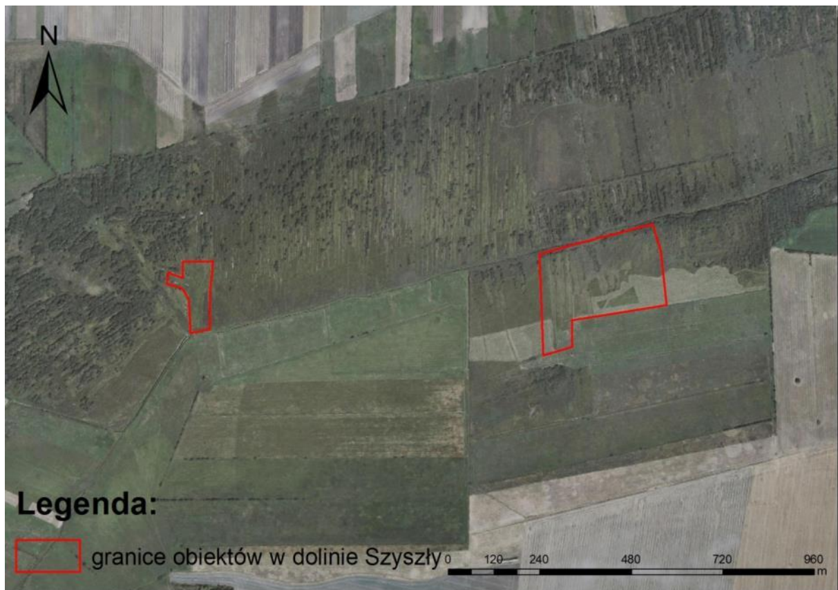
Ryc. 2. Lokalizacja obiektu na podkładzie ortofotomapy