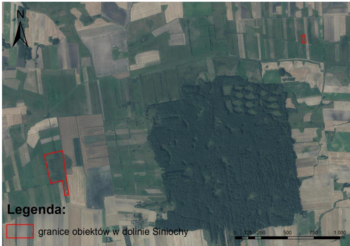
Ryc. 2. Lokalizacja obiektu na podkładzie ortofotomapy